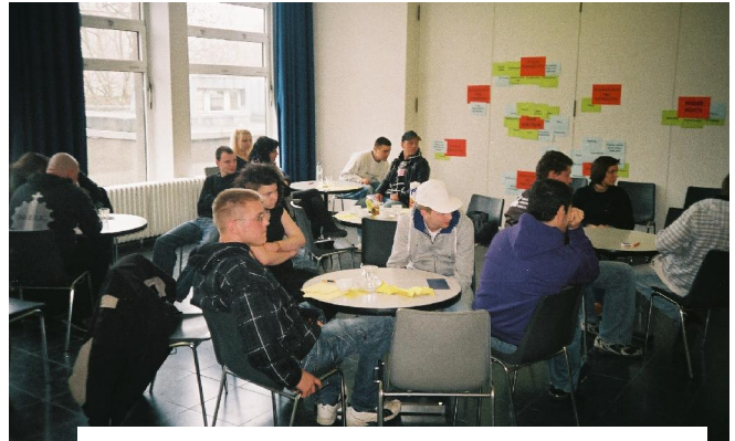
Seminar mit Jugendlichen (Jugendbildungsstätte Haus Kreisau) im Ökumenischen Gedenkzentrum Plötzensee (März 2010)

graphien christlicher Opfer der NS-Zeit bzw. christlicher Personen des Widerstandes, Hintergründe der Gewissensentscheidung und Glaubensentwicklung von Menschen des Widerstandes.