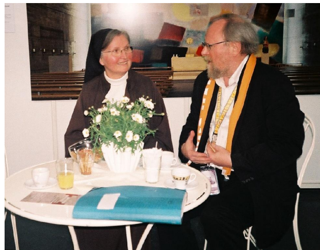
Der Stand auf der Agora beim ÖKT war ausgestaltet mit Reproduktionen der Wandbilder aus Maria Regina Martyrum und dem Gemeindezentrum Plötzensee (l.). Bundestagsvizepräsident Thierse lässt sich unseren Espresso schmecken (r.).