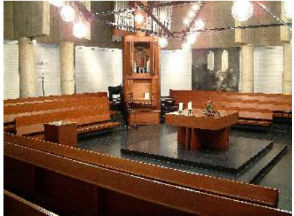
Kirchsaal im Gemeindezentrum Plötzensee

Der Kirchraum des Gemeindezentrums Plötzensee erfährt seine besondere Prägung durch den "Plötzenseer Totentanz" des Wiener Künstlers Alfred Hrdlicka. Auf 16 Tafeln von je 3,50m Höhe und 0,99m Breite greift Hrdlicka das Motiv der mittelalterlichen Totentänze auf und verweist damit auf die heutige Bedrohung der Menschen und Völker durch Gewalt, Macht und Willkür. Auf allen Tafeln sind zwei Rundfenster zu sehen sowie ein Balken mit Fleischerhaken - ein Hinweis auf den ehemaligen Hinrichtungsschuppen im nahegelegenen Gefängnis Plötzensee (heute Gedenkstätte, Hüttigpfad).